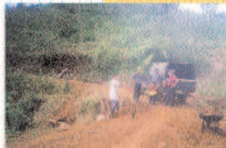
Apertura del camino en Ngöbe

Presupuesto: 85.359,52 Entidad cofinanciadora: Diputación Foral de Álava, que lo concedió el 9 abril de 2001.